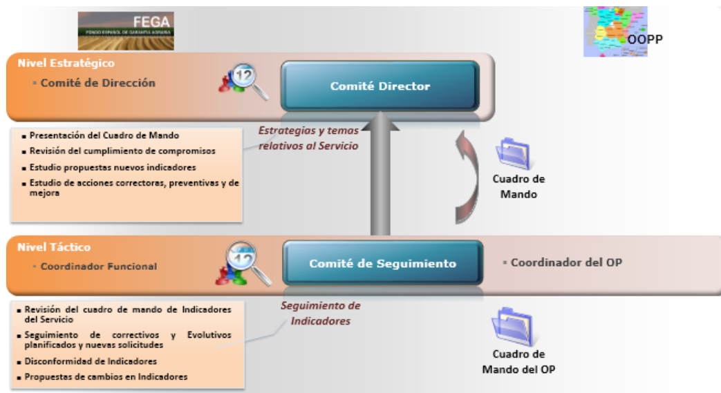
Ilustración 3. Modelo de control y seguimiento de indicadores

Comité Director periódico de control y seguimiento. Periódicamente, el FEAGA internamente revisará la adecuación de los indicadores de nivel de servicio a las necesidades del OP y al volumen de actividad real, estudiando la progresión de los mismos en el tiempo. Esta revisión puede acarrear diversas acciones correctivas, tales como: reorganización de equipos, mejoras de procesos operativos de soporte, recursos humanos y modificaciones en niveles de servicio y/o en la valoración de los servicios. En estas reuniones se comprobarán las desviaciones respecto a los niveles de servicio establecidos.