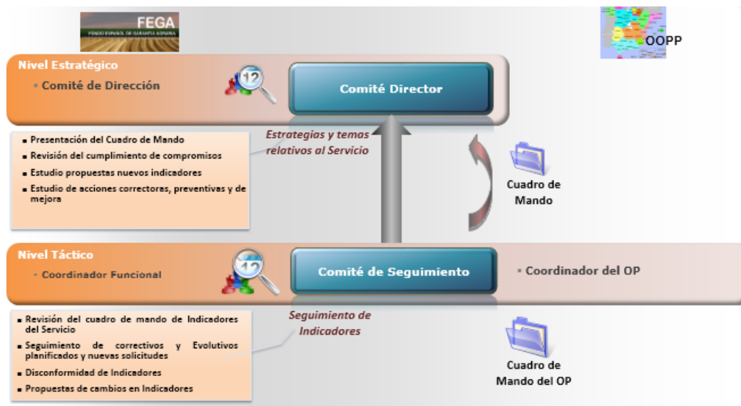
Ilustración 3. Modelo de control y seguimiento de indicadores

Comité Director periódico de control y seguimiento. Periódicamente, el FEGA internamente revisará la adecuación de los indicadores de nivel de servicio a las necesidades del OP y al volumen de actividad real, estudiando la progresión de los mismos en el tiempo. Esta revisión puede acarrear diversas acciones correctivas, tales como: reorganización de equipos, mejoras de procesos operativos de soporte, recursos humanos y modificaciones en niveles de servicio y/o en la valoración de los servicios. En estas reuniones se comprobarán las desviaciones respecto a los niveles de servicio establecidos.